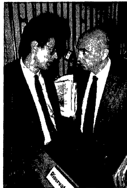
Chicco Testa e Giorgio Napolitano

COORDINATORE Gianni Pellicani, 57 anni pugliese di origine ma veneziano di adozione e di Venezia. È stato sindaco. Deputato dal 1972 al 1983 e daccapo dal 1987. È stato responsabile della commissione nazionale per le autonomie.