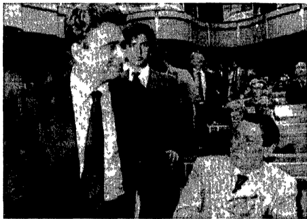
Achille Occhetto arriva alla Camera. A destra il capogruppo dei senatori dc Nicola Mancino

mentarsi in un'esperienza inedita ci siano le condizioni per lavorare a scelte impegnative e innovative». Senza separare l'attività del partito - insiste il segretario del Pci - «tra un'iniziativa ideale e di movimento e un'altra impegnata a insegnare i processi decisionali del governo» e senza stabilire «astratte gerarchie». Al contrario con lo scopo di «stabilire un filo unitario tra movimenti ideali progetti azione di governo». «È questa la via giusta per costruire un effettivo e moderno processo di decisione democratica» - una sfida che i comunisti lanciano a se stessi - «ma anche a tutte le altre forze politiche».